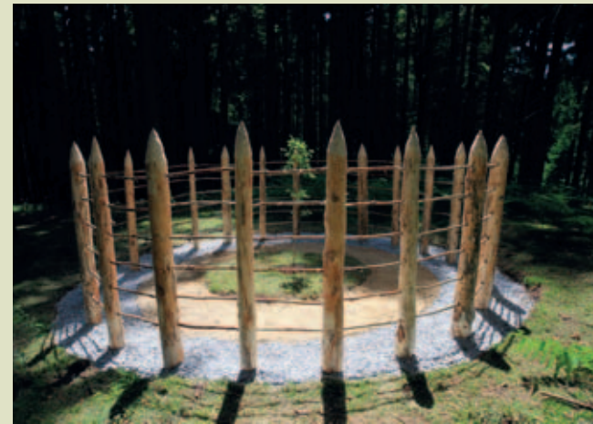
Den 5,6 Kilometer langen LandArt-Kunstpfad Bonstetten bilden neun Kunstobjekte.

Schonungslos der Witterung ausgesetzt, befinden sich Land-Art-Objekte im ständigen Wandel. Die Natur erobert sich zurück, was ihr gehört. So werden die Kunstwerke sukzessive wieder zu einem Bestandteil ihrer Umgebung – Natur wird Kunst und Kunst wird wieder Natur. Land-Art berührt alle Sinne, weckt die Phantasie und regt das Denken an. Sie lädt dazu ein, die Natur – und sich selbst als einen Teil davon – neu zu entdecken. Man kann und will sich der Ausstrahlungskraft von Land-Art-Objekten nicht entziehen.