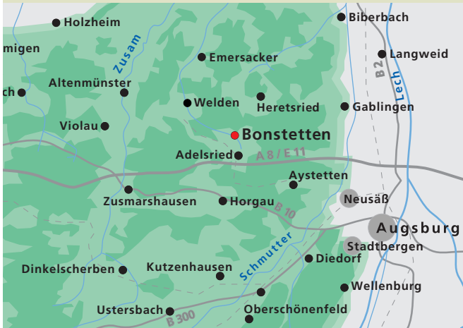
Die Gemeinde Bonstetten liegt nahe der A8, rund 20 Kilometer von Augsburg entfernt.