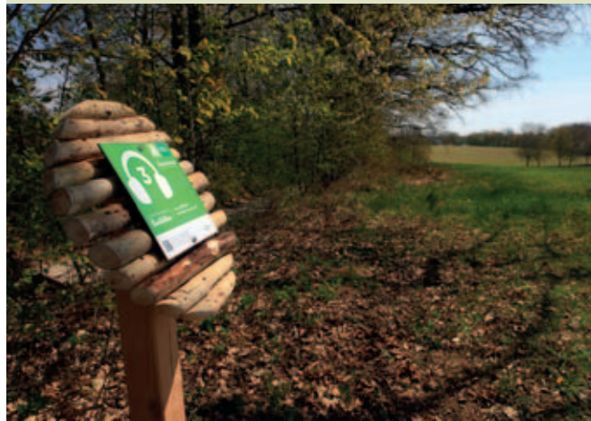
Den LandArt-Kunstpfad Bonstetten erkundet auch eine Lauschtour für das Smartphone.

Regio Augsburg Tourismus GmbH Telefon: 0821 50207-26 www.augsburg-tourismus.de/de/landart/landart-kunstpfad-bonstetten www.bonstetten.de