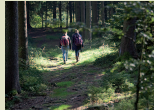
2500 Kilometer beschilterter (Rad-)Wanderwege durchziehen den Naturpark.

Natur, Geschichte, Genuss und Gastlichkeit: All dies findet man in dem beliebten Naherholungsgebiet Naturpark Augsburg – Westliche Wälder. Es ist Augsburgs „grüner Westen“. Die liebliche Kulturlandschaft mit waldreichen Höhenzügen, grünen Tälern und naturnahen Gewässern hat sich über die Jahrtausende entwickelt. Harmonisch in die Täler eingebettete Ortschaften warten mit etlichen Sehenswürdigkeiten und einladender Gastronomie auf. 2500 Kilometer markierter Rad- und Wanderwege durchziehen den Naturpark und garantieren einen abwechslungsreichen Freizeitgenuss sowie Entspannung abseits großer Menschenmassen.