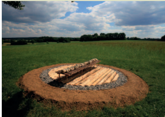
Im Naturpark Augsburg – Westliche Wälder liegt Deutschlands größter Land-Art-Park.